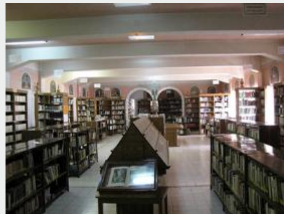
Seminário em Belém