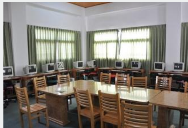
Centros de estudo e informática