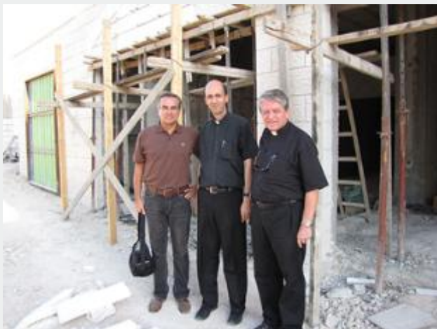
Loja de livros para cristãos