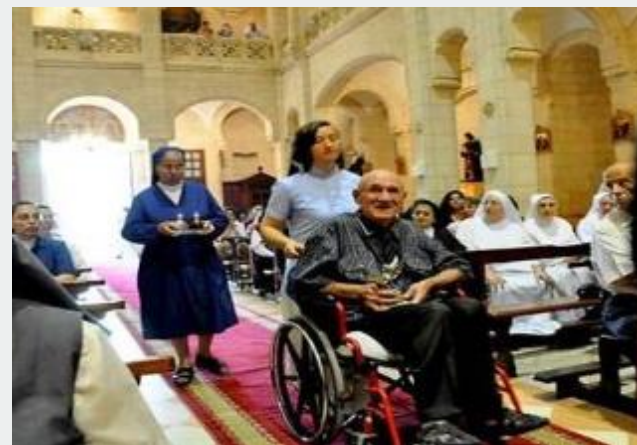
Assistência para idosos