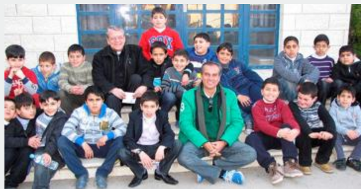
Escola em Belém