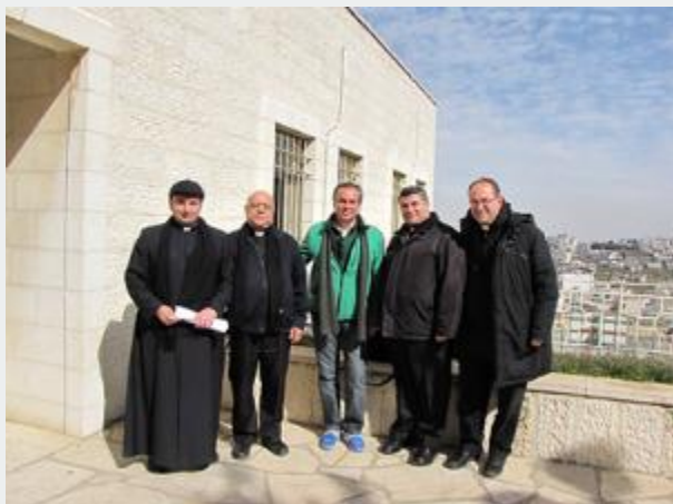
Seminário em Belém