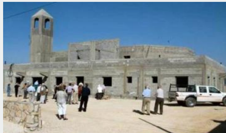
Construção de igrejas