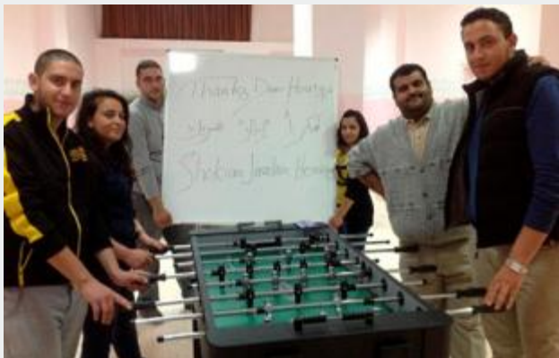
Centro para juventude - Jordânia