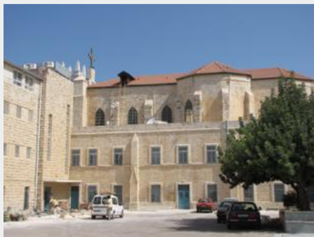
Projetos de restauração