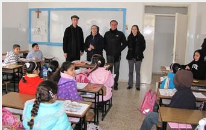
Escola em Taybeh