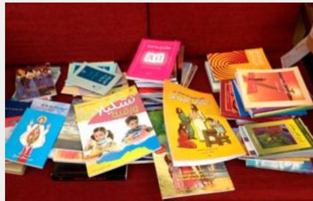
Gráfica de livros cristãos