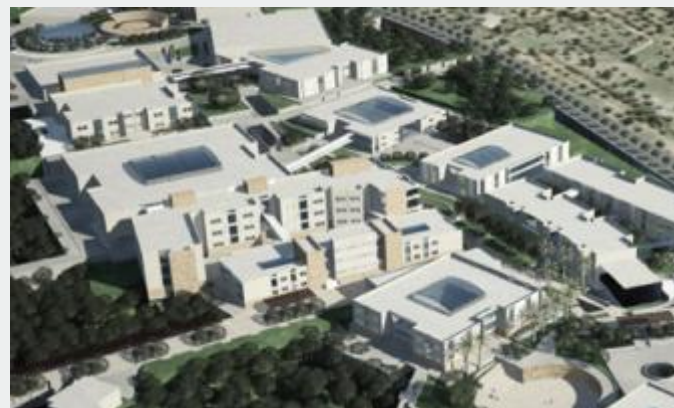
Universidade de Madaba, Jordânia