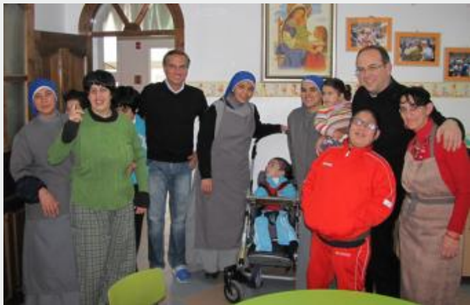
Abriço para crianças - Belém