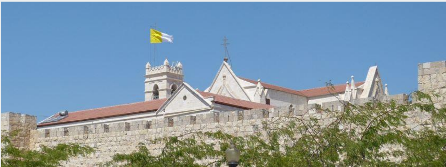
Patriarcado Latino de Jerusalém