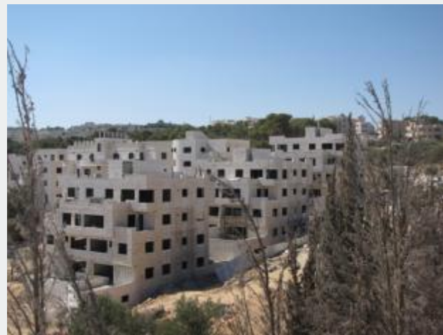
Projetos habitacionais - Beit Safafa